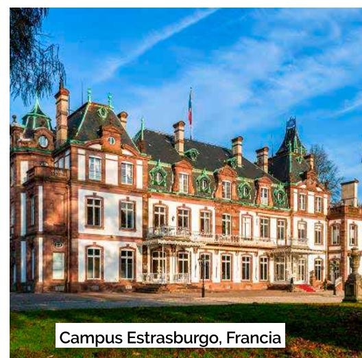
Campus Estrasburgo, Francia