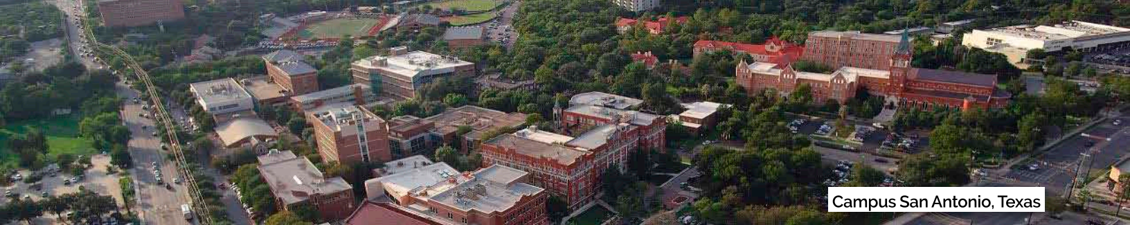
Campus San Antonio, Texas