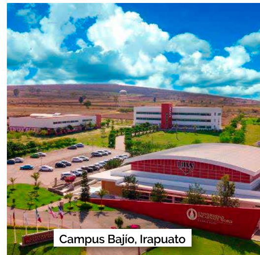
Campus Bajío, Irapuato