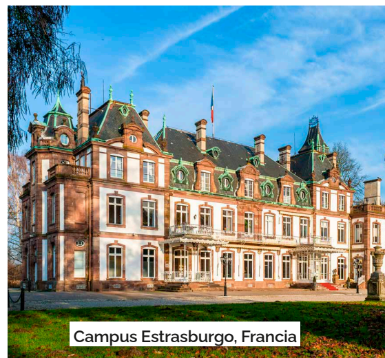
Campus Estrasburgo, Francia