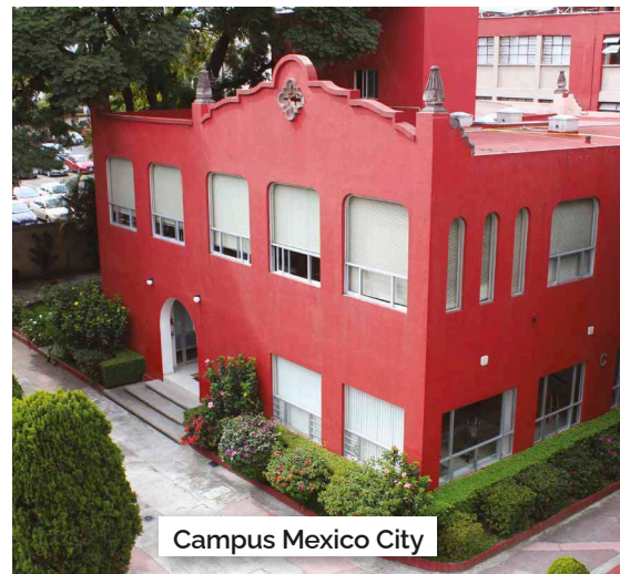
Campus Mexico City