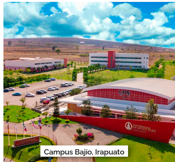
Campus Bajío, Irapuato