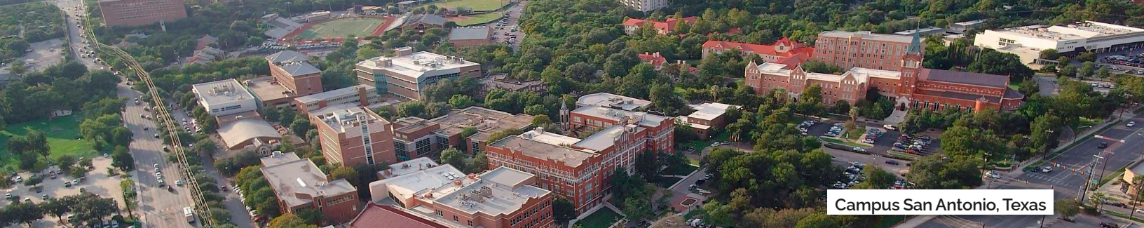
Campus San Antonio, Texas